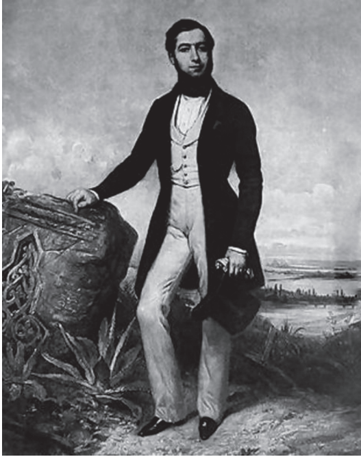
فردينان دي لسبس.